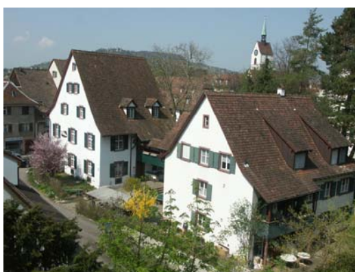
...zusammen unter zwei Dächern wohnen; eine Frau mit einer Wohnung im Quartier gehört auch zur Gemeinschaft