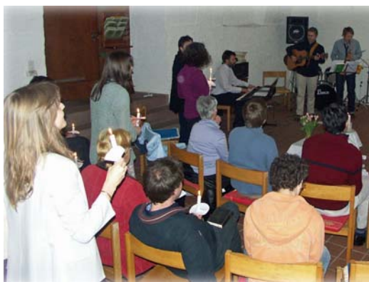
...an Ostern gemeinsam die Auferstehung von Jesus feiern