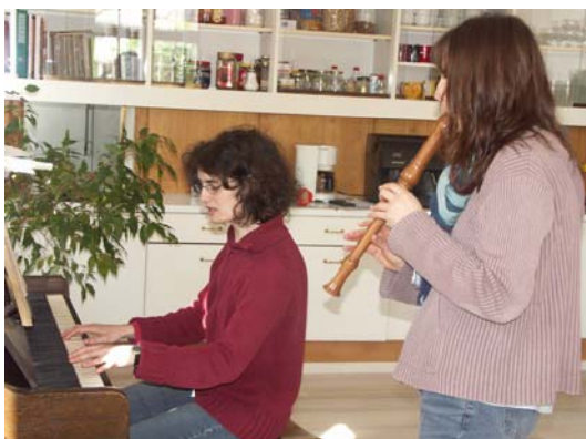
...zusammen musizieren: hier im Esszimmer