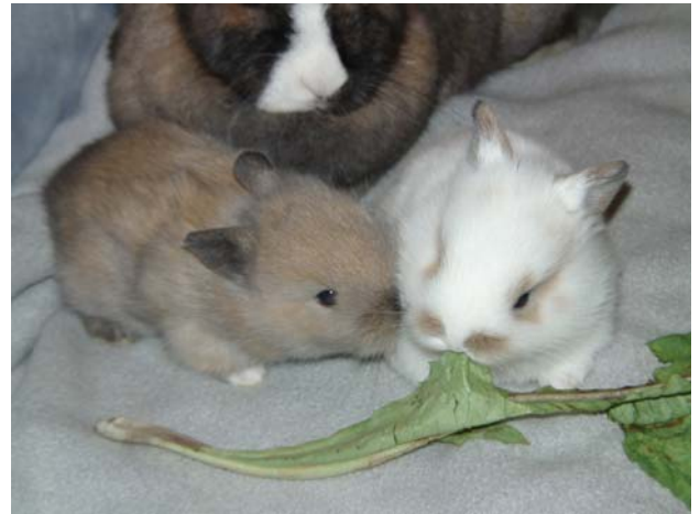
Zwei Wochen später