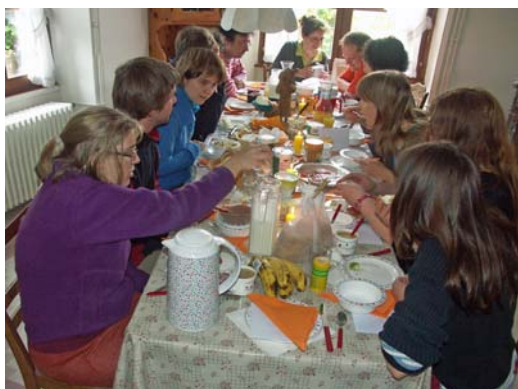
...zusammen essen – hier an Pfingsten in Melecey/F