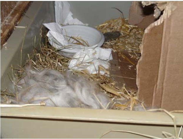
Das Nest kurz vor der Geburt

verdoppelt. Zum Vergleich: Ein Mensch braucht dazu ca. 180 Tage. Im Moment nehmen die Babys pro Woche etwa 60 gramm zu. Sie springen umher, geniessen ihren ersten Freilauf und sind schon sehr zahm. Rahel Widmer (11)