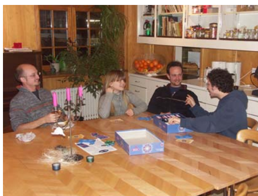
...zusammen spielen am Abend